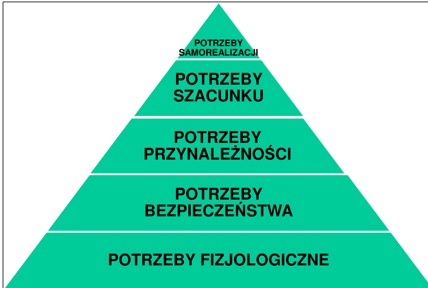
Rys. 1. Hierarchia potrzeb ludzkich A. Maslowa [Maslow, 1943]